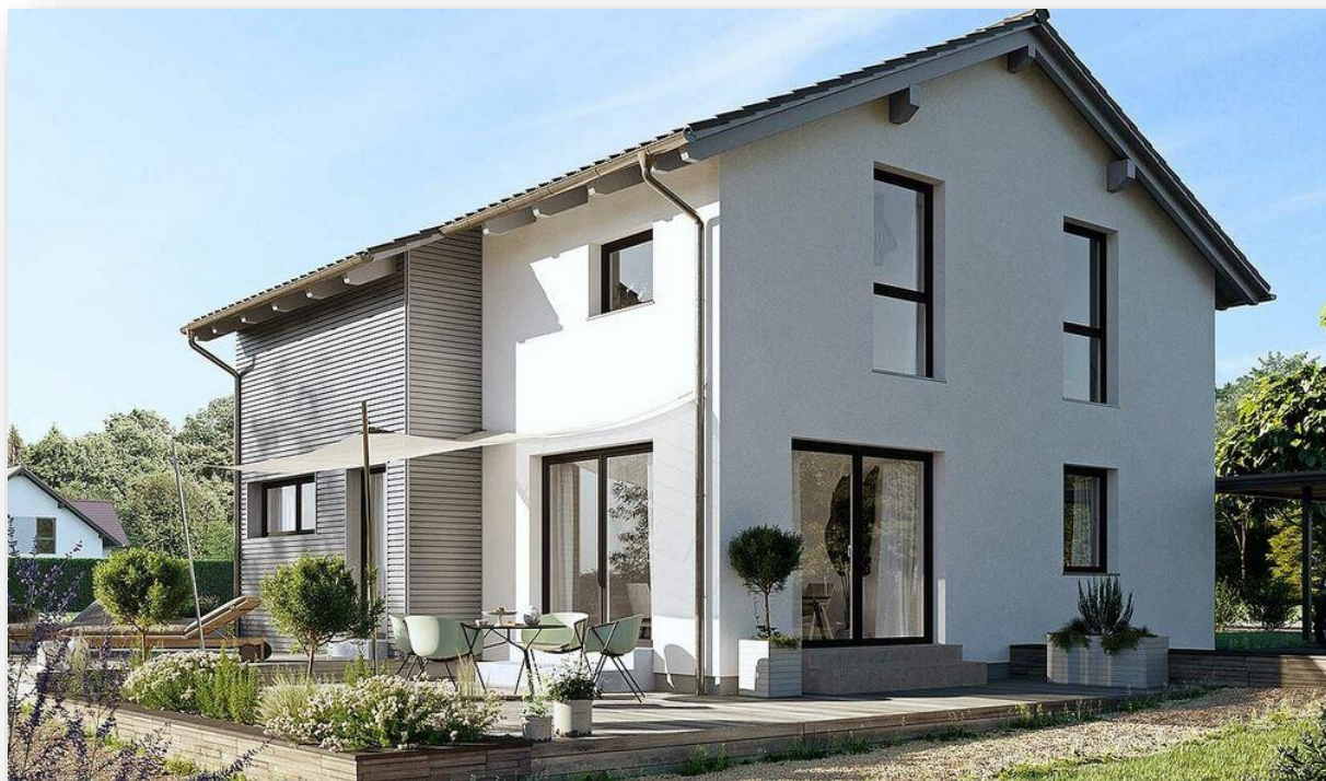
Beispiel Variant 25-135